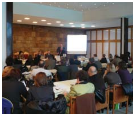
Радионица у Врњачкој Бањи

У периоду 08.12. - 10.12.2009. године, у Нишкој Бањи, Крагујевцу и Врњачкој Бањи су такође одржане радионице за запослене Центра за катастар непокретности Ниш, Крагујевац и Краљево.