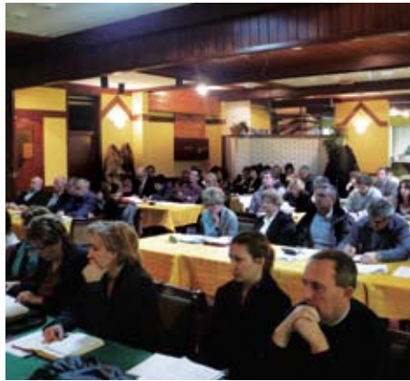
Радионица у Новом Бечеју

Друга радионица одржана је 03.12.2009. у просторијама седишта РГЗ-а за запослене из Центара за катастар непокретности Београд и Шабац, као и из седишта РГЗ-а.