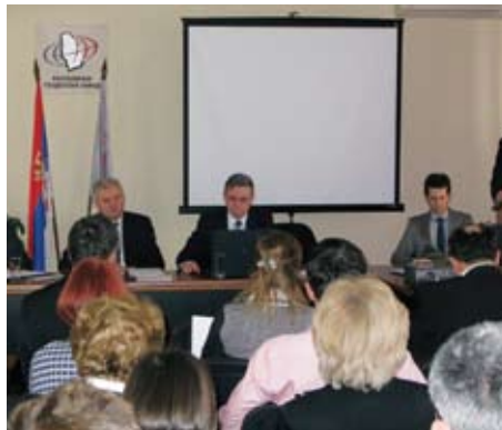
Радионица у седишту РГЗ-а